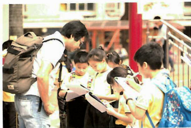
在戶外學習日，三年級學生到何文田社區實地考察。

學校亦一直在擴展校外學習，常識科設有戶外學習日，配合常識科的學習主題，各級學生會到訪香港不同的地方，透過觀察和發問，對不同的課題有更