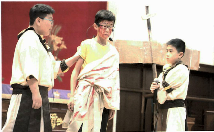
學生在復活節崇拜中演繹聖經故事。

作為一所基督教背景的學校，學校將基督的道理滲入到日常教學及校園生活之中。除了每個循環周一次的聖經堂以及早會外，每天上課前都設有課前靈育時間，班主任會跟學生分享聖經故事，以及以聖經的角度分析事件。每天早上，學生都可以成為「代禱勇士」，為有需要的同學禱告，讓孩子學習關心身邊人的需要。三至六年級學生也可自由選擇加入團契，令蘇校長很難忘的是有一次，要為學校開放日