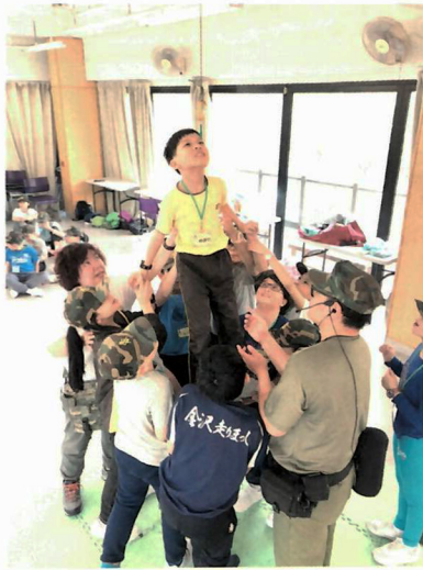
學生在歷奇訓練營中，學習團體合作。

為了提升學生的自理能力和抗逆力，所有學生都要參加「生活技能訓練營」，一、二年級是日營，三年級以上便是宿營，由2日1夜至4日3夜不等。蘇校長指出，這一代的孩子在家裏集萬千寵愛在一身，很多事情都不用自己動手做；但參加宿營，學生便需要學習執拾行李、清洗自己的衫褲，並進行連串歷奇活動，能提升學生的自律、自理及解難能力，促進他們與人溝通的技巧，學習互相尊重及團體合作精神。