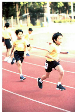
學生參加陸運會，一展運動潛能。

生和家長能有更多的親子時間，家長可趁這段時間，帶孩子到圖書館、參觀博物館或親親大自然，拉近親子關係之餘，也可以擴闊眼界。