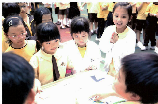
中文科「語文樂滿紛」攤位遊戲，提升學生學習中文的興趣。

入的了解。一年級學生學習與公園有關的主題，所以到香港動植物公園，認識公園設施和動植物；三年級的學生到何文田社區，實地考察社區內的各項設施和不同種類的房屋。學生更有機會負笈海外，如台灣、上海、日本及新加坡等地，進行不同主題的學習，見識當地的文化。