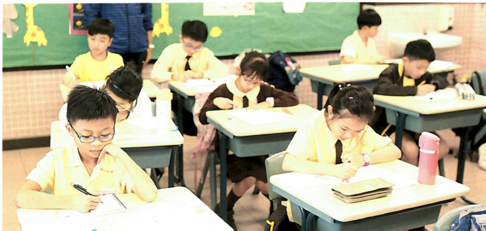
學生善用功課導修課的時間，完成大部份功課，回家便能享受空閒時間。