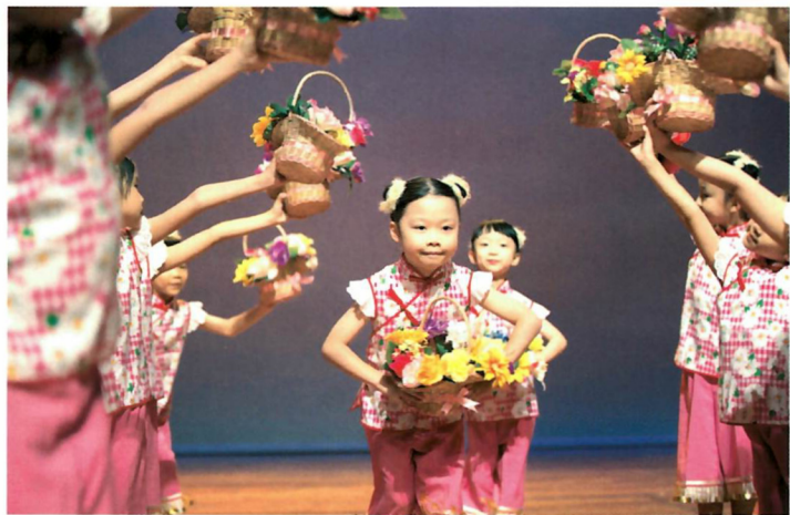
學生在綜合表演晚會以中國舞演出，精采萬分。