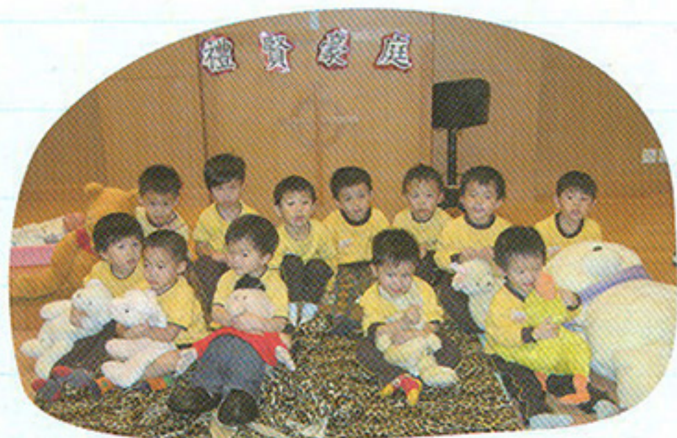
每星期一天的Free Day會舉行特別的活動，這天大家就來到「禮賢家庭」玩耍。