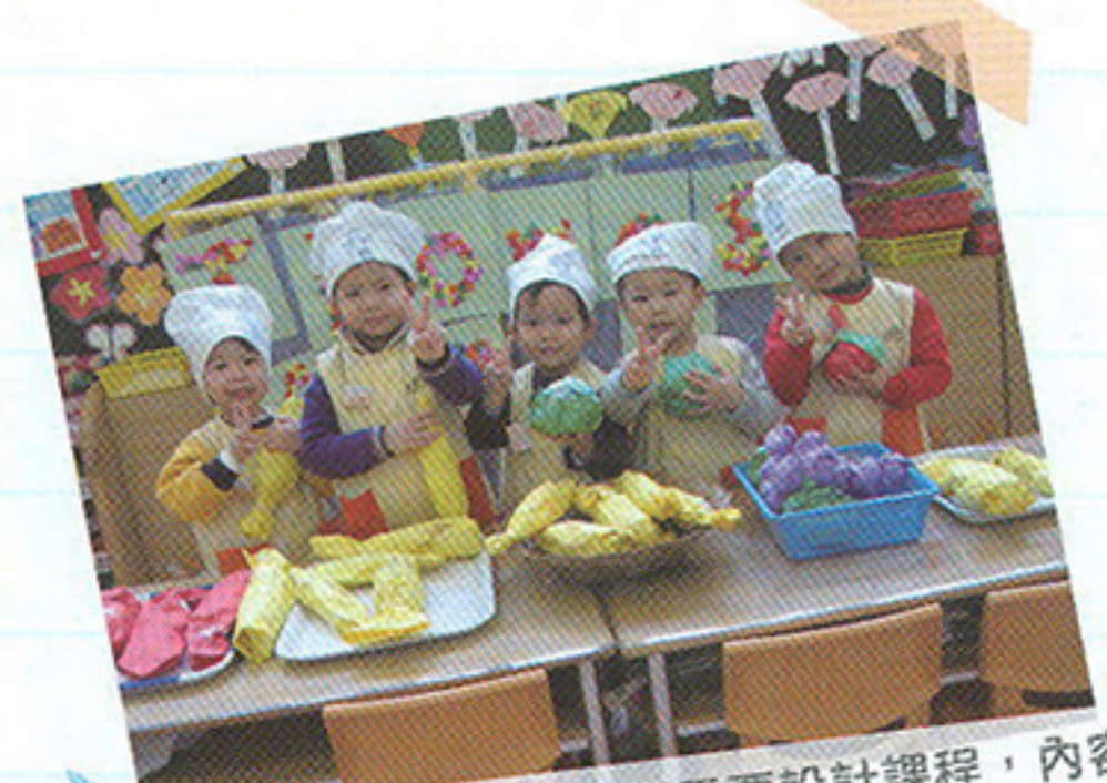
學校按照幼兒的發展需要設計課程，內容貼近小朋友的生活經驗。

九龍禮賢學校暨幼稚園是基督教學校，重視小朋友的生命品格教育。「我們會將基督的核心價值教給小朋友，如懂得感恩、珍惜、誠實，希望我們的小朋友擁有不同的質素，這是貫徹三年幼稚園生活的教育，期望小朋友