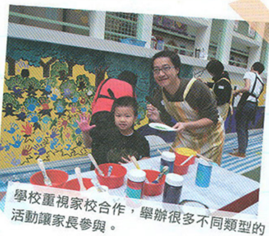
學校重視家校合作，舉辦很多不同類型的活動讓家長參與。

去年學校收到接近1800份報名申請，當中錄取了140名小朋友入讀幼兒班。幼稚園的面試會以小組形式進行，老師會讓小朋友自