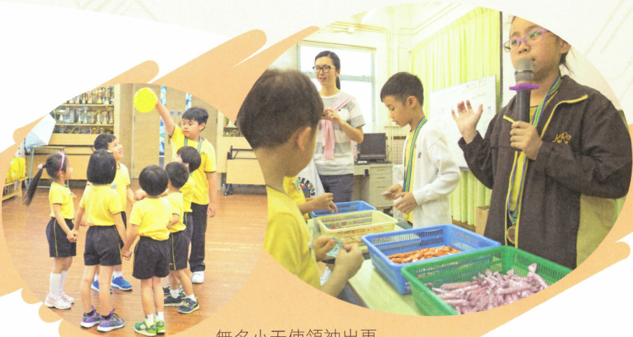
無名小天使領袖出更