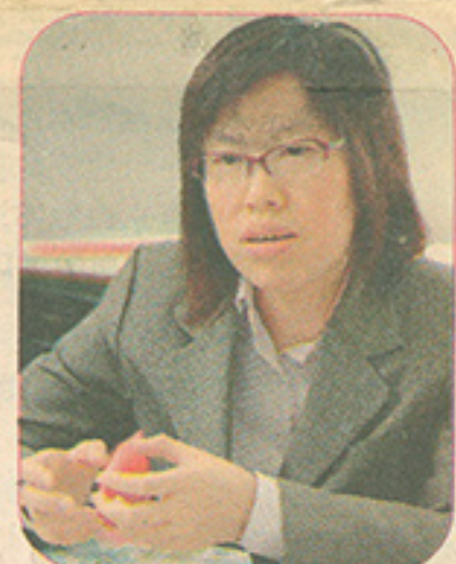
▲何太坦言，兒子的性格害羞而畏縮，但升上小學後漸漸改善。

父母最高興見到子女能自發學習，品德有長進。家長何太坦言，老師的教導的確令升讀小三的孩子性格轉變。「他讀幼稚園時，是個害羞的孩子，沒有膽量面對群眾，不會參加任何活動。但升上小學後，性格不斷改變，老師的確發揮了愛心。有一次，他要在同學和家長前表演，扮演地鐵控制員，拿著告示牌不作聲地指揮。雖然如此，但他很投入。之後，又主動替代請病的同學扮演一隻病狗，又吠又跳地表演。我沒想過他可以這樣做。又有一次，因為公司惹上官非令我受憂慮。他在「代禱小勇士」時間與同學分享，然後為我祈禱，令我很感動。」