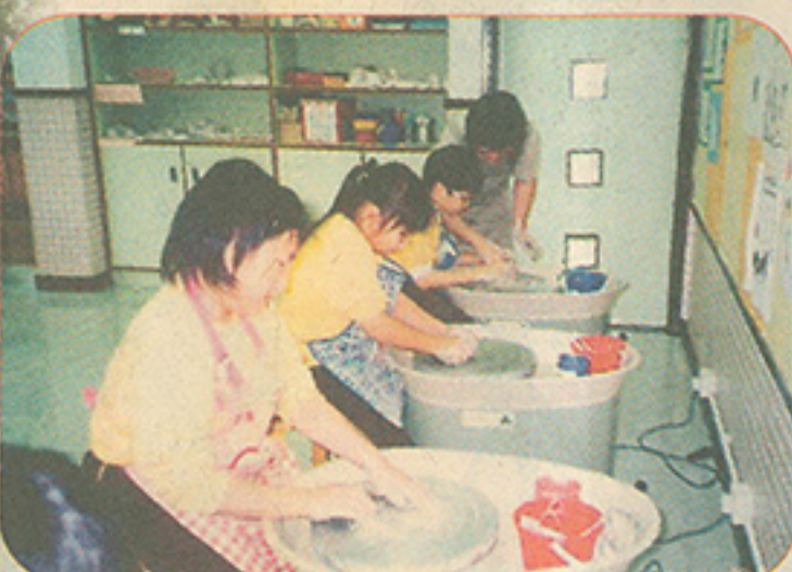
▲聯課活動提供多種體育和藝術活動讓學生參加，發掘學生多方面的潛能。